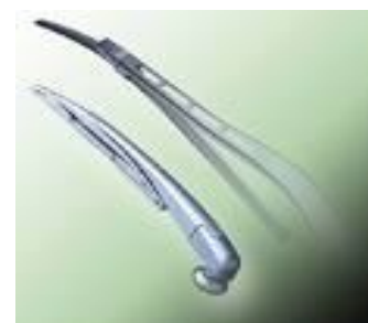
Rys.2, 3, 4. Obecne wersje wycieraczek samochodowych.