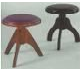
Rys. 11, 12. Współczesne modele - motorówka i stołki dla pianistów.

Wśród wynalazków „człowieka fenomena”, znajdują się również motorówka i regulowany fotel dla pianistów. Ciekawi mnie, co zainspirowało go do skonstruowania motorówki. Fotel dla pianistów - rzecz jasna zainspirowany potrzebami pianisty. A motorówka? W jaki sposób wpadł na ten pomysł?