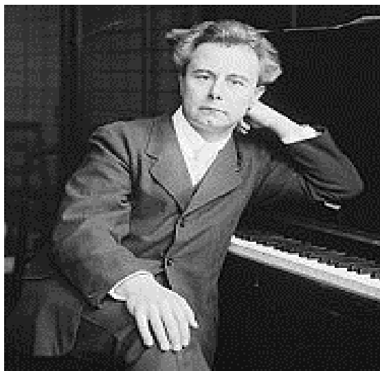
Rys.1. Józef Hofman (1876-1957), pianista, kompozytor, pedagog i wynalazca.