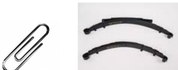
Rys. 7, 8. Spinacz biurowy i resory samochodowe.