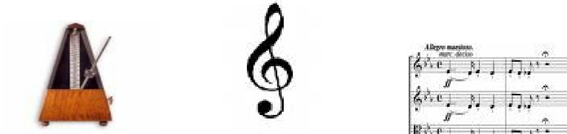
Rys. 5, 6. Metronom, klucz wiolinowy oraz łuki w zapisie nutowym. Inspiracje do powstania wycieraczek samochodowych, spinacza biurowego i resorów.