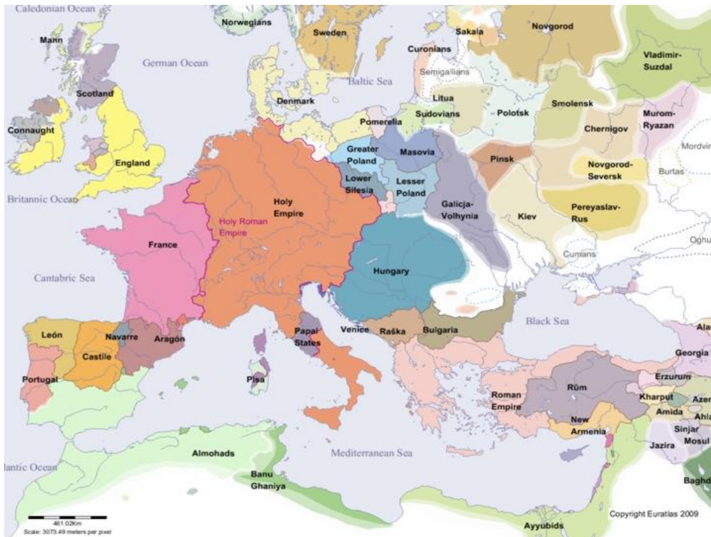
Rysunek 2. Europa na początku wieku XIII