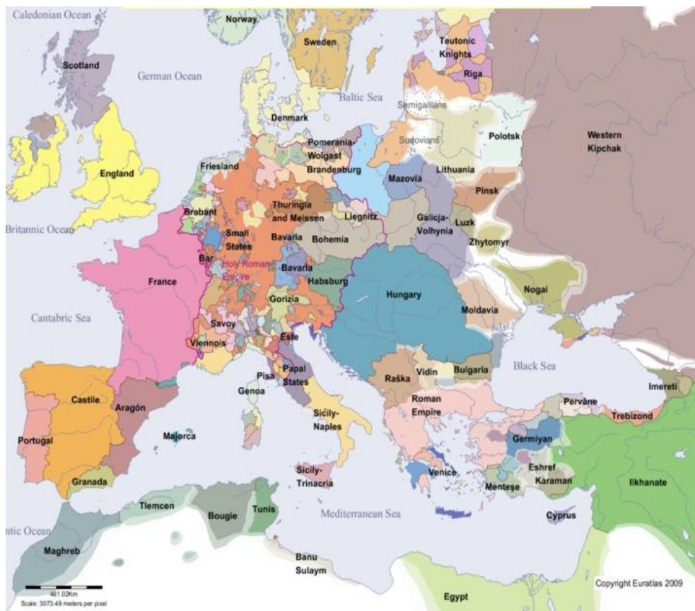
Rysunek 3. Europa na początku wieku XIV