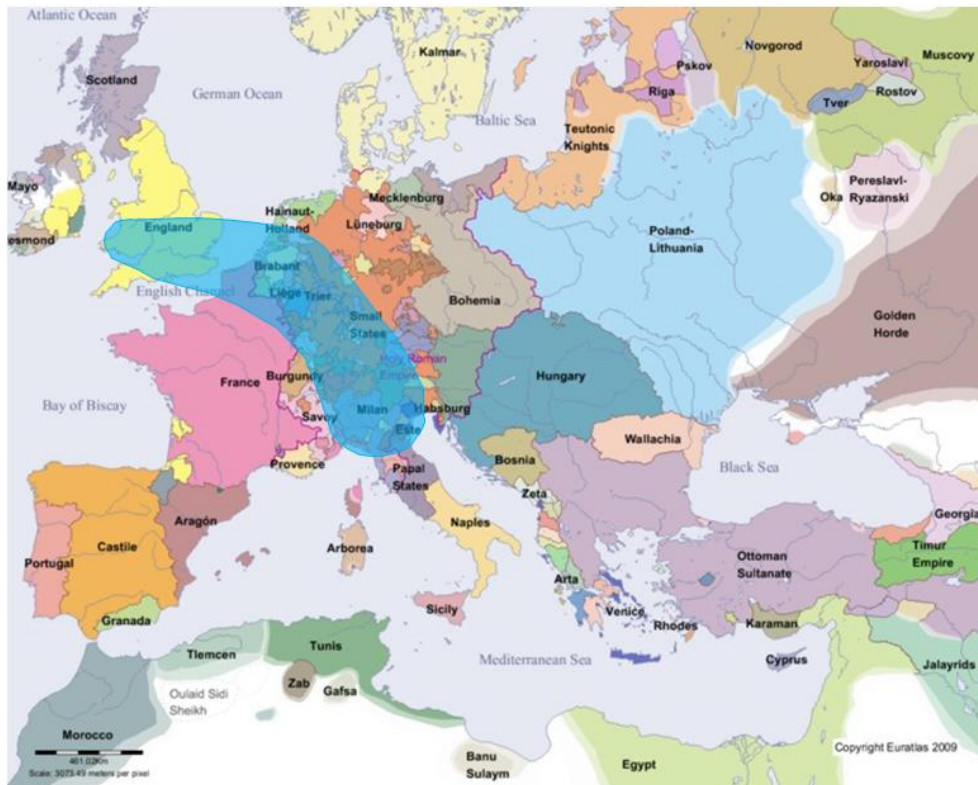
Rysunek 4. Europa na początku XV wieku z zaznaczonym najbogatszymi obecnie regionami (tzw. europejski banan lub niebieski banan).

Obecnie Unia Europejska składa się z 268 regionów (w Polsce są to województwa). Jeśli popatrzylibyśmy na rozkład geograficzny tych najbogatszych regionów to przyjmuje on charakterystyczny kształt banana (zwanego często europejskim bananem, albo niebieskim bananem). Obszar ten zaznaczyliśmy na Rys. 4. Już pierwsze, pobieżne porównanie map Europy w XV wieku z obszarem regionów obecnie najbogatszych (patrz Rys. 5) w UE wskazuje na niemalże pełną tożsamość rozdrobionych regionów w późnym średniowieczu (które bardzo silnie ze sobą współzawodniczyły, konkurowały), z regionami obecnie najbogatszymi w UE. To nie jest przypadek. W tych regionach najsilniej występowały też inne elementy składające się na ewolucję w kierunku budowy społeczeństwa kapitalistycznego (o których wspominam w tym artykule).